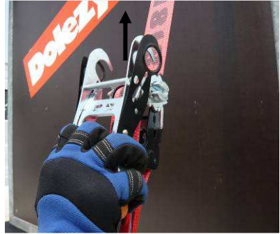
Abb. 6-7: Wenn der Fingerschieber bis zum Anschlag durchgezogen wird (über den ersten Widerstand hinaus), lässt sich der Handgriff nach vorne von dem Ratschenkörper abnehmen.