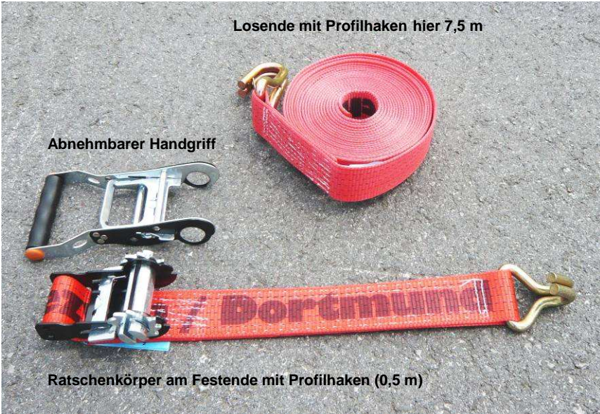
Abb. 1: Festende und Losende.