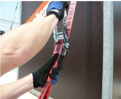
Abb. 4: Spannen durch Auf- und Abwärtsbewegungen des Handgriffs, bis die gewünschte Vorspannkraft erreicht ist. Ratsche nach dem Spannen schließen.