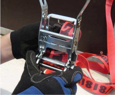
Abb. 2: Einführen des Gurtbandes