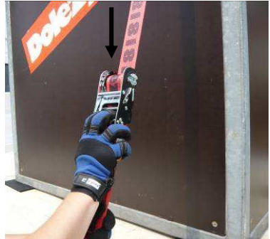
Abb. 8-9: Zum Anbringen des Handgriffs auf dem Ratschenkörper wird der Fingerschieber bis zum Anschlag durchgezogen (über den ersten Widerstand hinaus) und von vorne auf den Ratschenkörper gesetzt