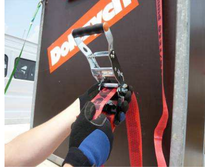
Abb. 3: Per Hand auf die gewünschte Länge festziehen.