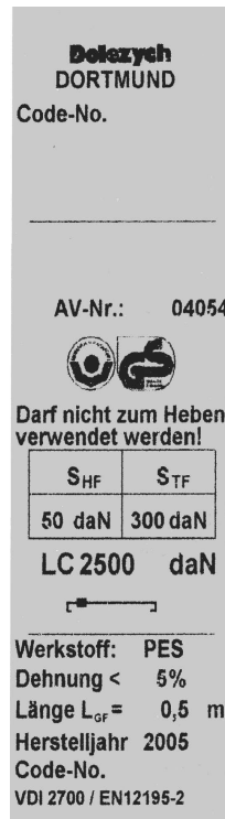
Abb.2: Bsp. eines Etiketts nach DIN EN 12195-2