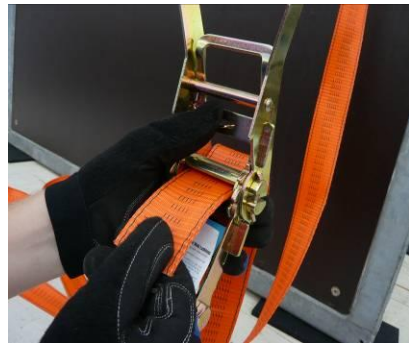
Abb. 3: Per Hand auf die gewünschte Länge festziehen.